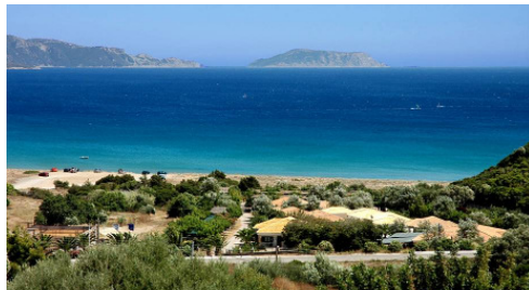
Die Bucht in Finikounda

Das Seminar findet in Finikounda (Griechenland) statt. Die Unterbringung ist in Doppelzimmern, auf Wunsch auch Einzelzimmer (Aufpreis € 15/pro Tag). Die Verpflegung beinhaltet ein gemeinsames Frühstück und ein abendliches Menü bestehend aus einem Salat, einem Hauptgericht und einem Glas Wein.