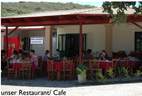
unser Restaurant/ Cafe

Oft stellt sich an dieser Stelle die Frage nach Verantwortung. Kann und will ich die Verantwortung für mich und den Konflikt übernehmen? Es ist die Frage nach den Konsequenzen und die trifft auf Unmut und auf „sich entziehen wollen“, so dass sich der Kreis schließt.