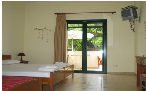
eines unserer Appartements

Ich möchte in den 5 Tagen Seminar unterschiedliche Lösungsstrategien entwickeln, Entscheidungen und Handlungskonsequenzen üben und Ängste bearbeiten. Darüber hinaus werden wir an individuellen Konflikten im Sinne von integrativer Therapie, die ich vertrete, arbeiten. D. h. systemische Konflikte in Aufstellungsarbeit (hier sind Erfahrungen wünschenswert), lösen, Beziehungskonflikte in Klärung bringen (Schwerpunkt der Woche) und mit Körperorientierter Arbeit Konflikte lösen und integrieren.